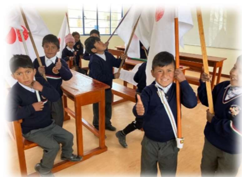
Aulas (Pucarani, La Paz)

Solo son elegibles aquellos proyectos que puedan concluirse antes de un año desde la otorgación del financiamiento.