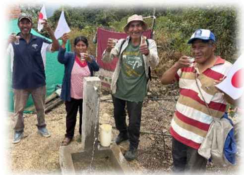
Sistema de agua potable (Uquina, La Paz)

La APC es una herramienta creada para que los Gobiernos subnacionales o las organizaciones no gubernamentales o las instituciones sociales sin fines de lucro , que estén formalmente establecidas, puedan responder a las necesidades de sus comunidades.