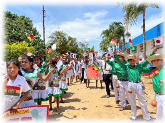
Aulas (San Pedro, Santa Cruz)

Si el monto de la solicitud es mayor a los 20.000 USD (veinte mil dólares americanos), la embajada requerirá la contratación de una empresa auditora , cuyo costo deberá incluirse en el presupuesto solicitado, manteniendo los porcentajes de participación (embajada del Japón financia el 87 % y la entidad solicitante aporta el 13 % restante).