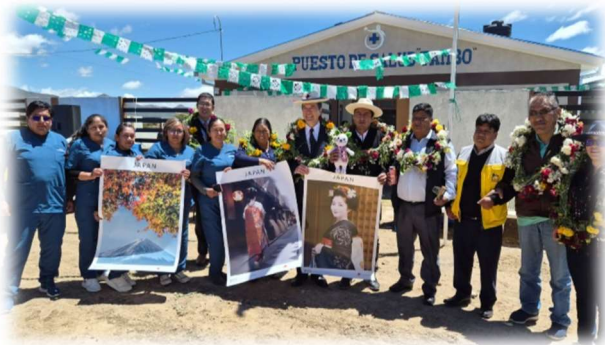
Puesto de salud (Tupiza, Potosí)

Gran parte de los proyectos financiados por la APC están relacionados con la educación y la salud. Siguiendo los proyectos enfocados a mejorar el acceso al agua o los sistemas de saneamiento. Sin dejar de lado a las propuestas orientadas a fortalecer servicios sociales, como por ejemplo centros de protección para grupos humanos vulnerables.