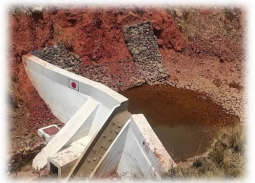
Sistema de riego (Escoma, La Paz)