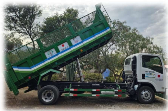
Camión volqueta (Tiquipaya, Cochabamba)

La propiedad de los elementos donados debe ser de carácter colectivo o público , o administrados por entidades elegibles.