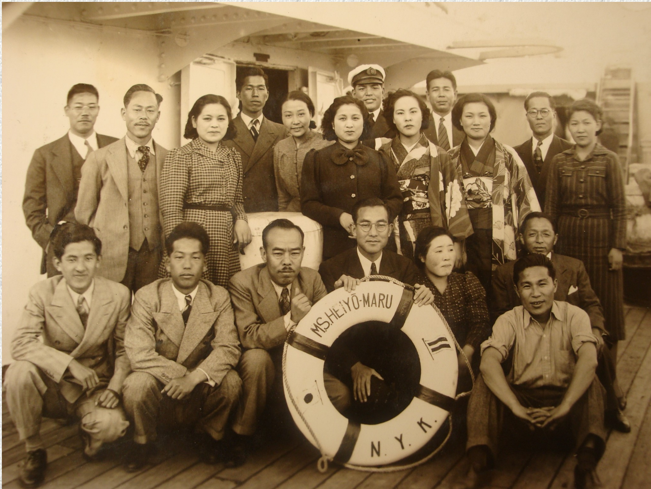
Inmigrantes en el barco