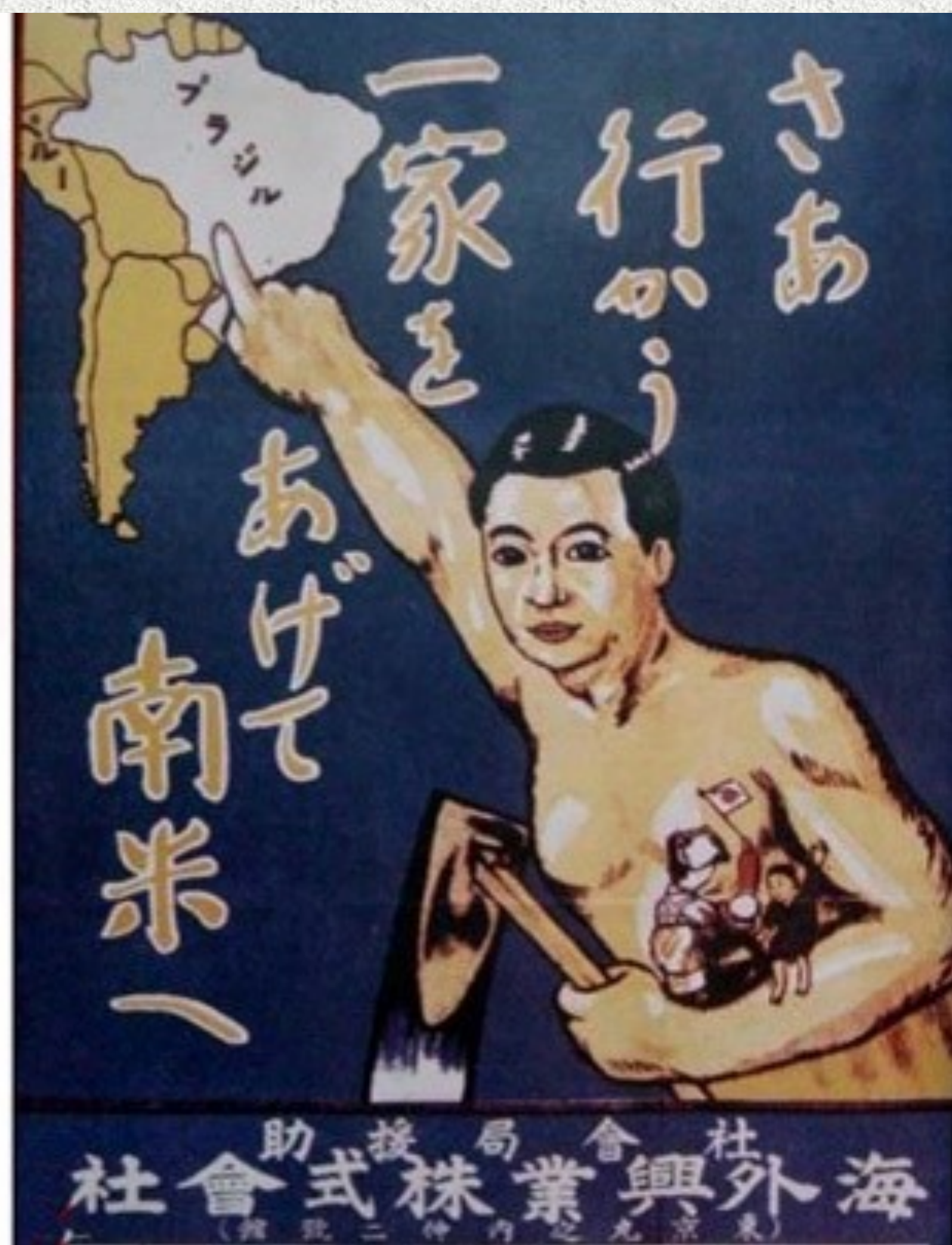
Afiche de convocatoria para migrar a Sudamérica