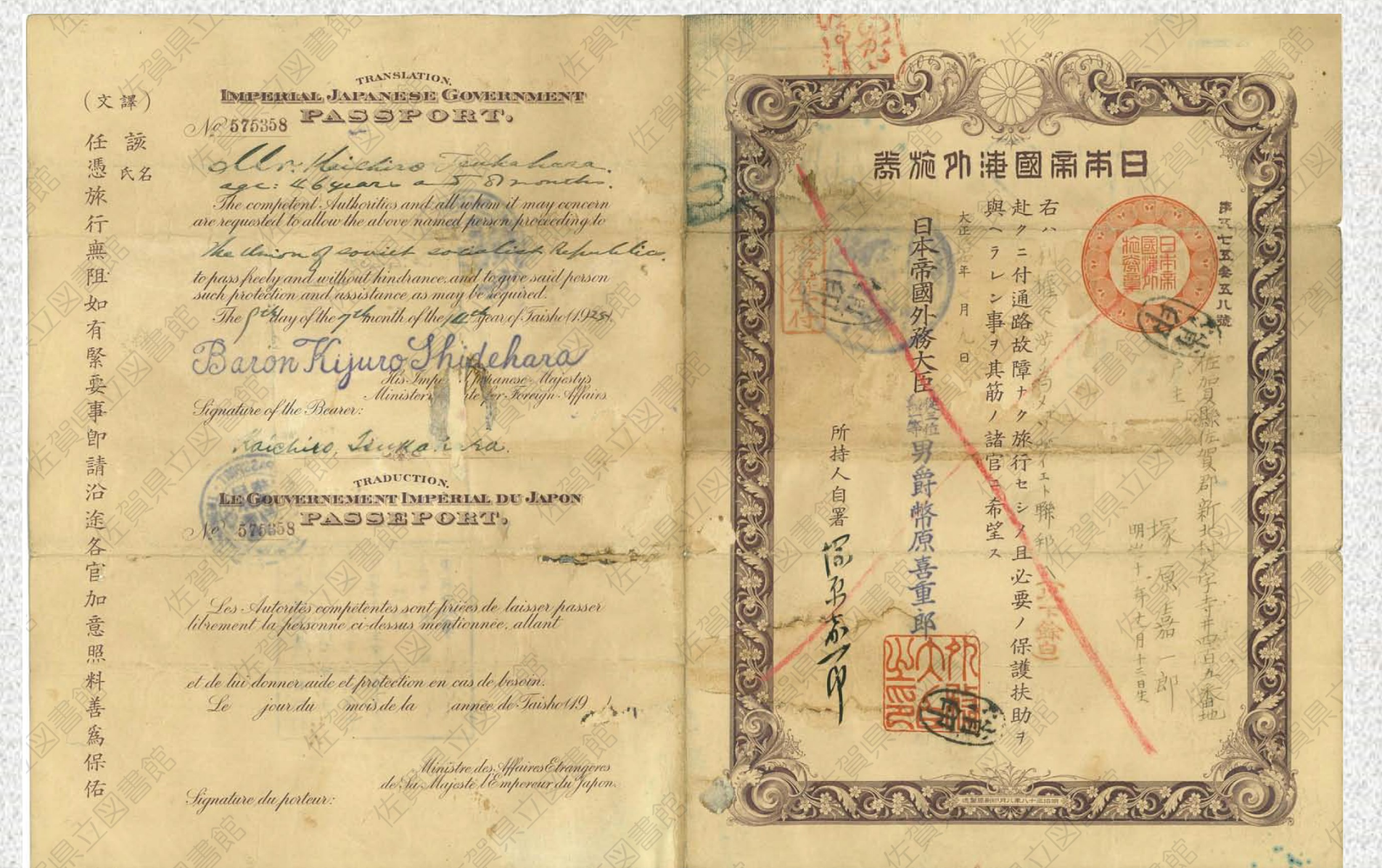
Pasaporte japonés del año 1925