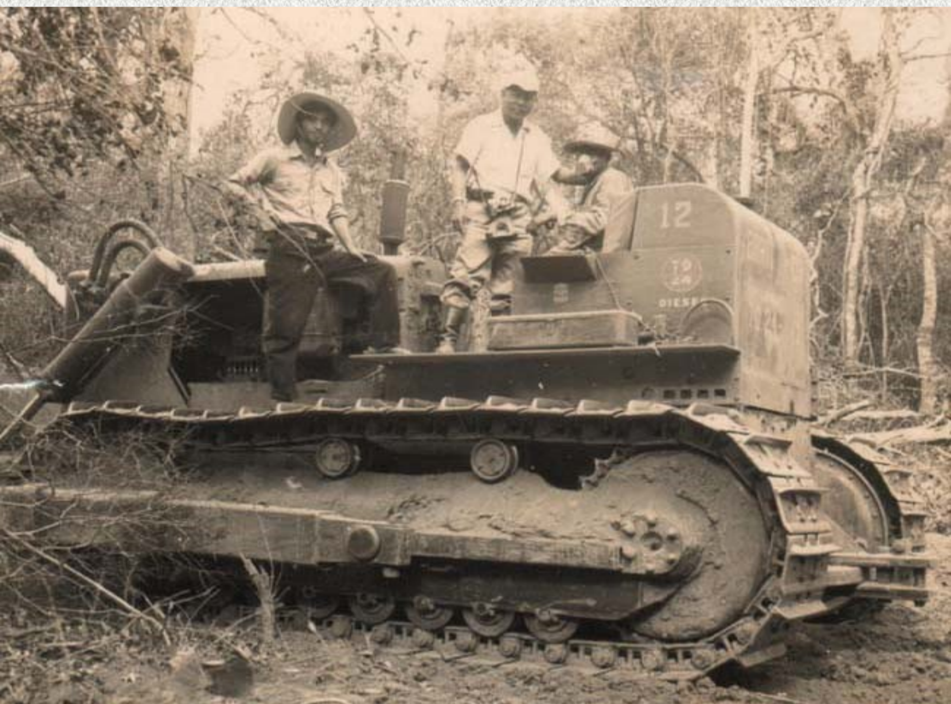
Trabajos iniciales en la colonia

Tras conocer esta situación, los originarios de Okinawa que vivían en La Paz y Riberalta, plantearon la instalación de la colonia Okinawa en Bolivia, logrando en 1953 el ofrecimiento de 10.000 hectáreas de tierras fiscales dentro del departamento de Santa Cruz.