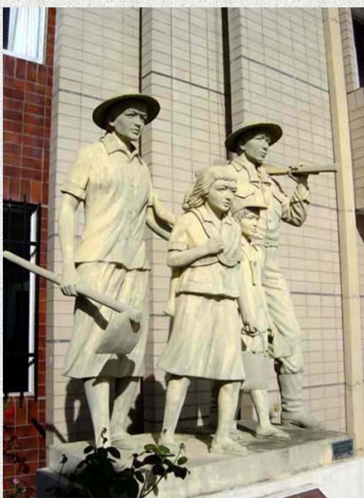
Monumento dedicado a los inmigrantes en Okinawa

El 15 de agosto de 1954, llegaron a la denominada colonia Uruma ( Paraíso en el dialecto de Okinawa) 278 personas del primer grupo de inmigrantes de Okinawa, seguidos por la llegada de 127 personas un mes después.