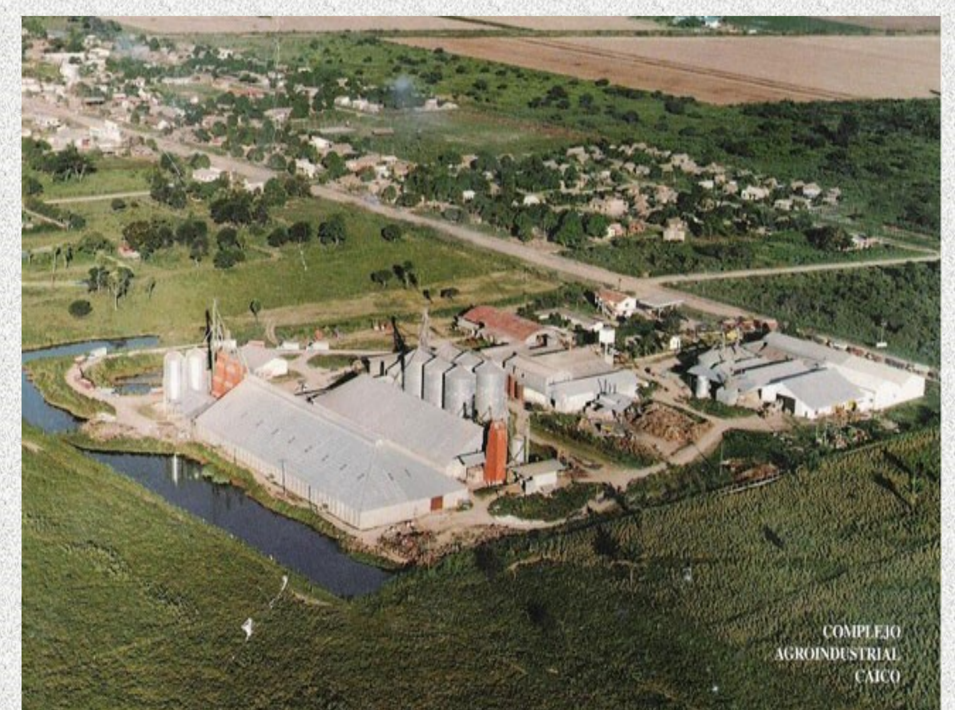
Complejo agroindustrial en Okinawa 1