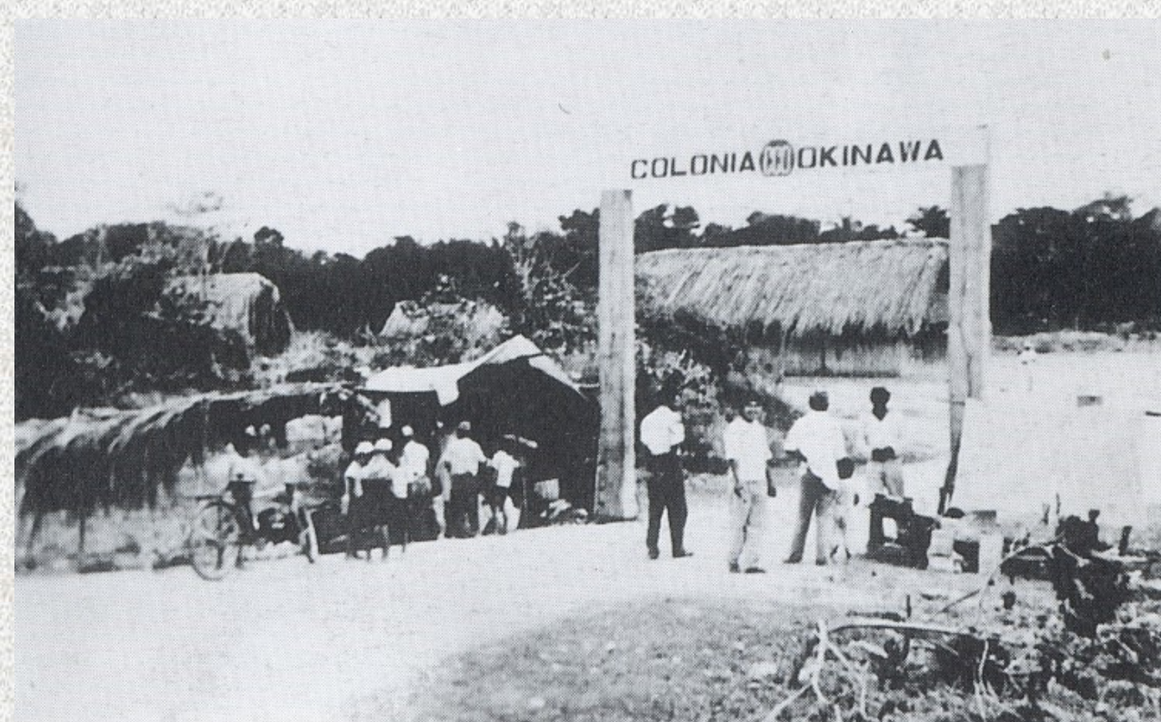
Entrada de Okinawa 1 en sus inicios

La inmigración planificada hacia la colonia permitió el ingreso de 19 grupos hasta 1964, llegando un total de 3.229 personas.