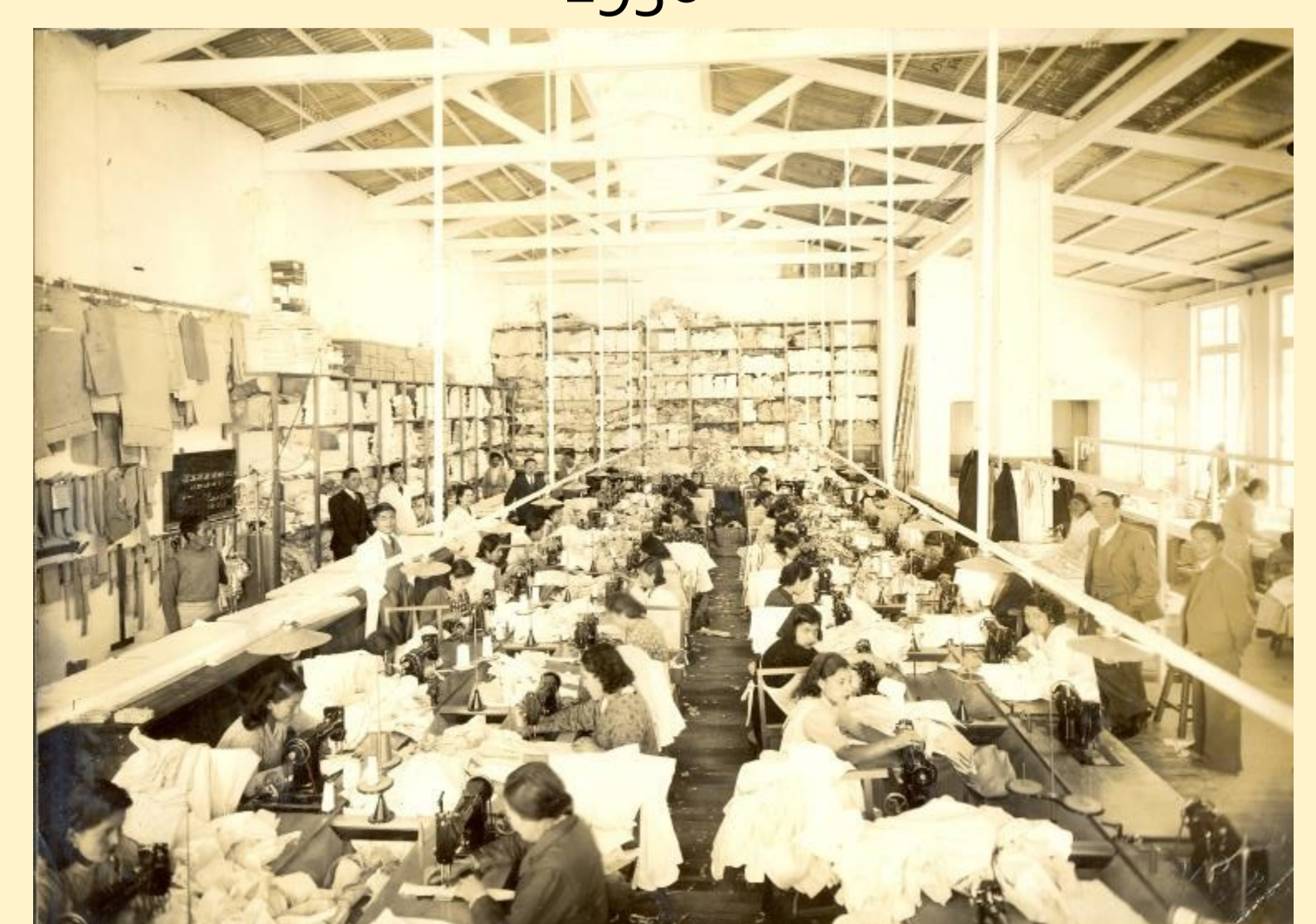
Fábrica de camisas de la Casa Komori