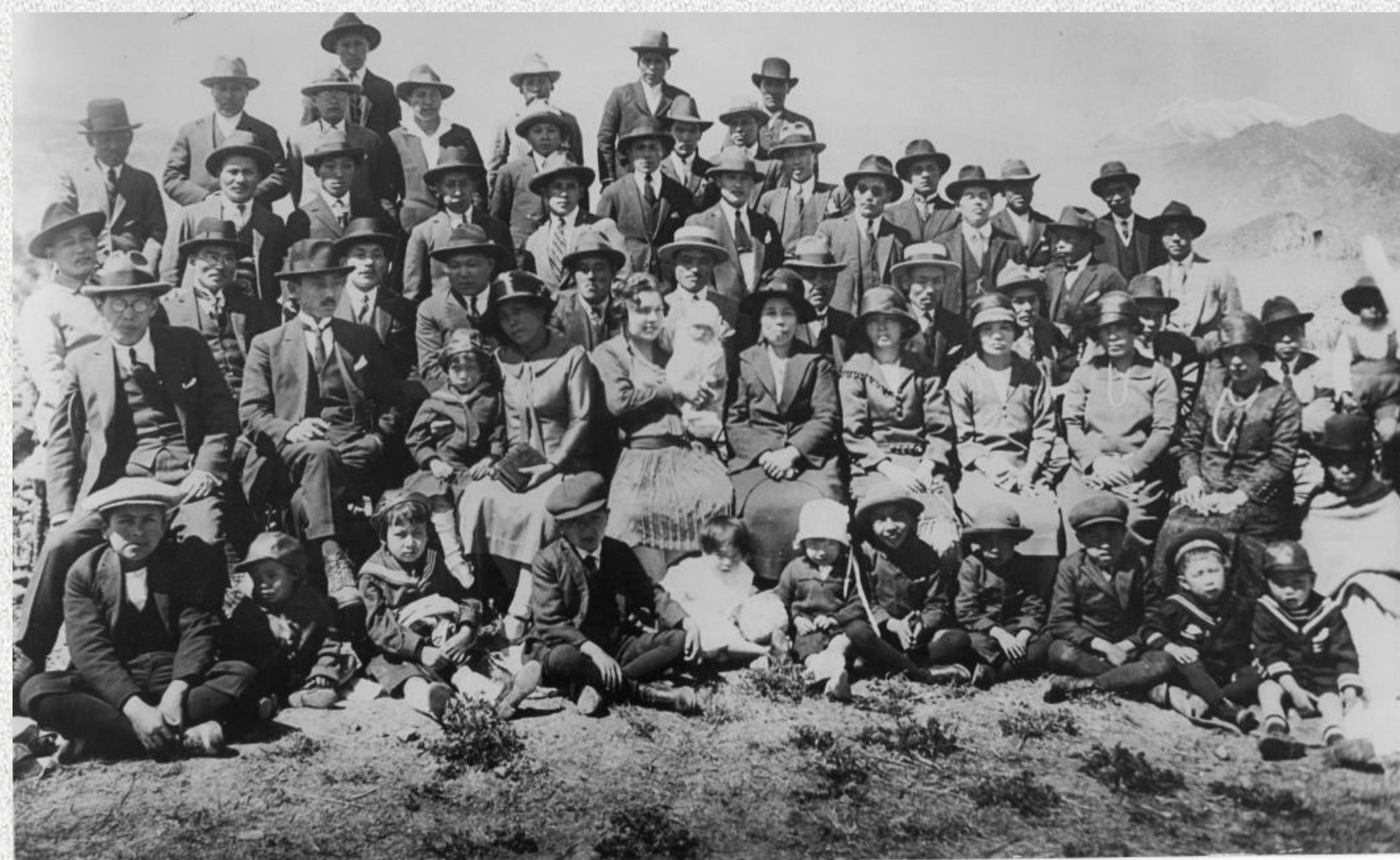
Miembros de la Sociedad Japonesa de La Paz, 1928