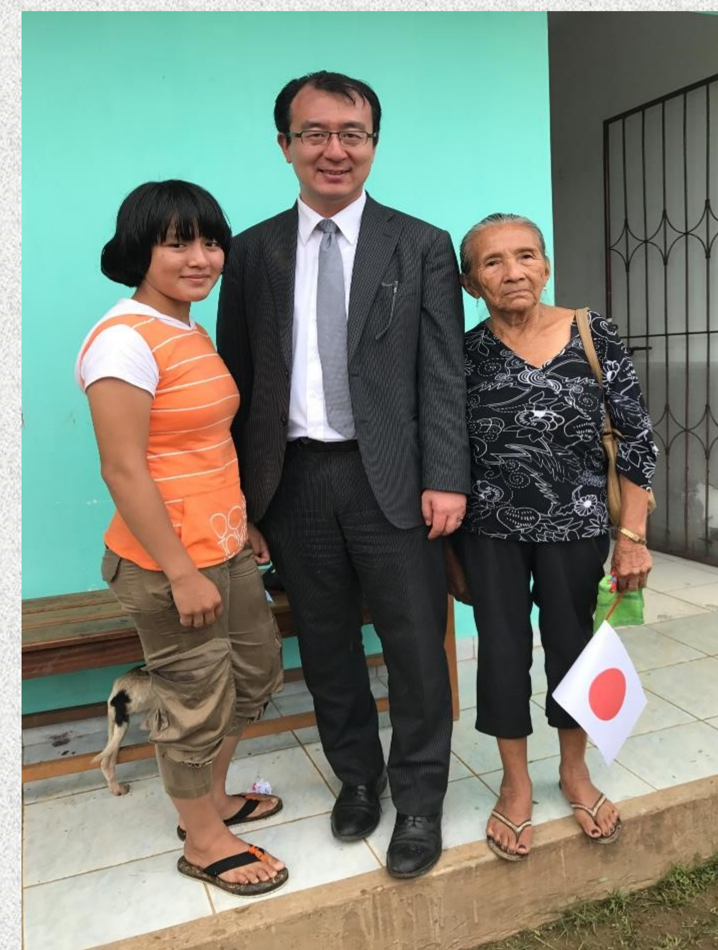
Descendiente de quinta generación (izquierda) y de tercera generación (derecha) en Santa Fé, Villa Nueva, Pando, 2017