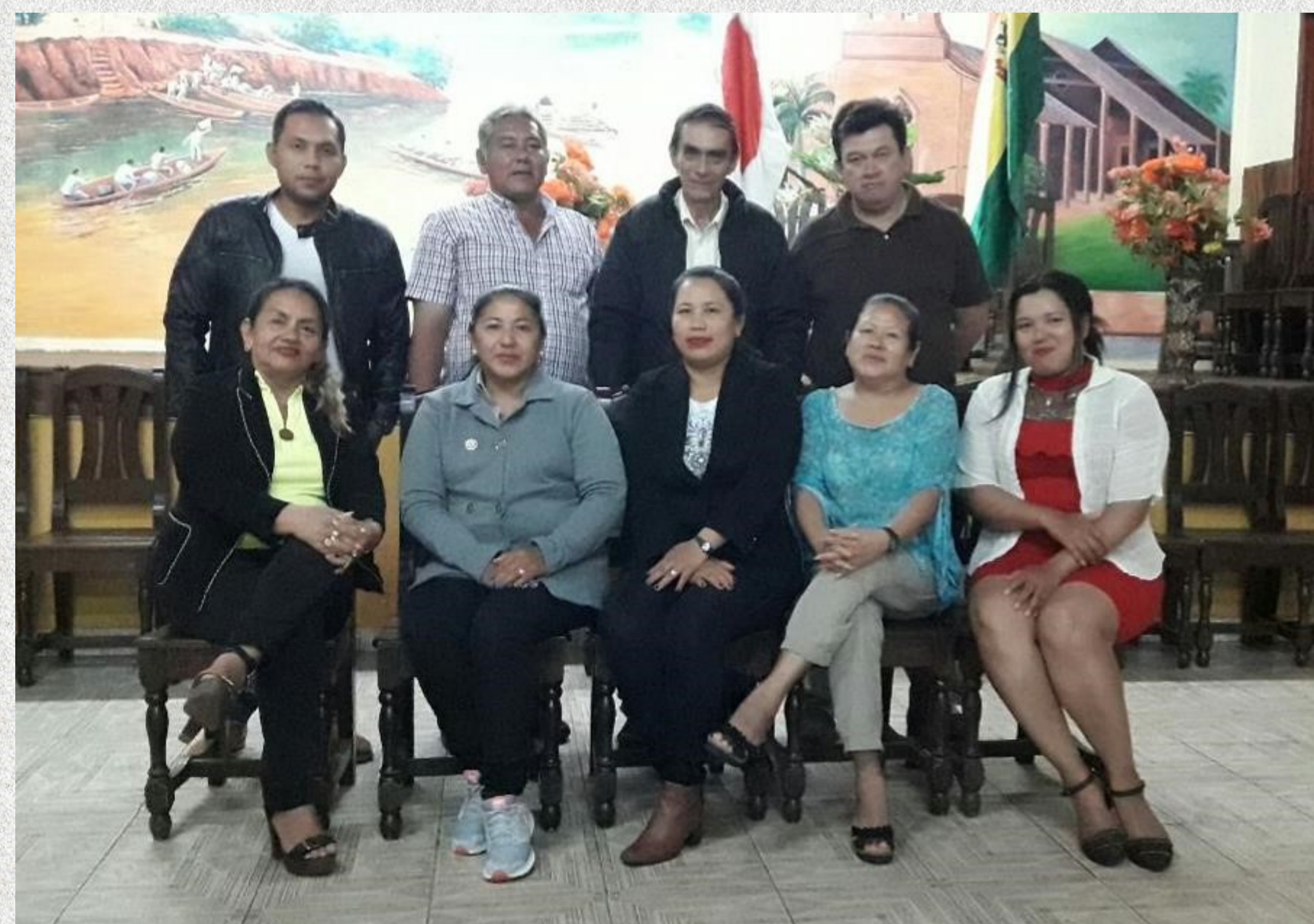
Descendientes japoneses de Porvenir

El Club Boliviano Japonés de Porvenir fue refundado el 22 de abril de 2018.