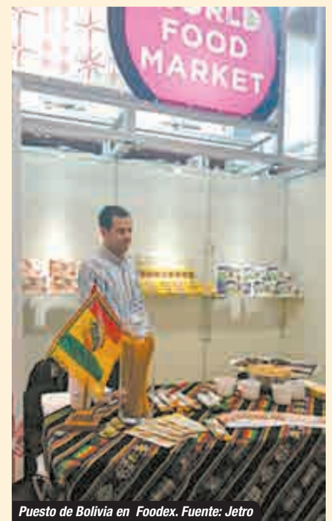
Puesto de Bolivia en Foodex.

En el campo alimentario, JETRO organiza anualmente la feria internacional de alimentos y bebidas más grande del Asia: el FOODEX, realizada en Japón, donde en 2016 participaron alrededor de 76 mil visitantes y 3 mil empresas provenientes de 79 países. Dos compañías bolivianas de quinua y chíca y sus derivados exhibieron sus productos.