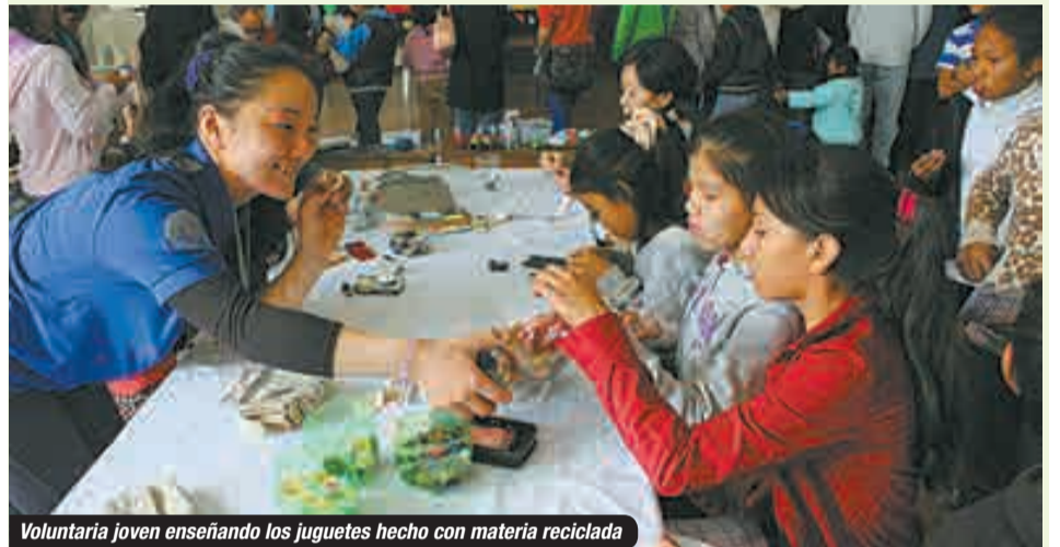
Voluntaria joven enseñando los juguetes hecho con materia reciclada

En 1962 se inició la modalidad de cooperación técnica japonesa en Bolivia y en 1978 se firmó el Acuerdo de Cooperación Técnica entre los dos gobiernos. Desde entonces, y hasta 2014, Japón envió 1376 expertos y 1193 voluntarios japoneses a Bolivia, y recibió a 5904 expertos bolivianos para capacitarlos. Actualmente, 53 cooperantes japoneses (jóvenes entre 20 a 39 años de edad y sénior entre 40 a 69 años de edad) están trabajando en todo el territorio boliviano por un periodo de dos años, desempeñándose en sectores como los de medioambiente, salud, manejo de residuos sólidos y compostaje, educación, obstetricia, análisis de calidad de aguas, procesamiento de alimentos, aparatos eléctricos y electrónicos, entre otros.