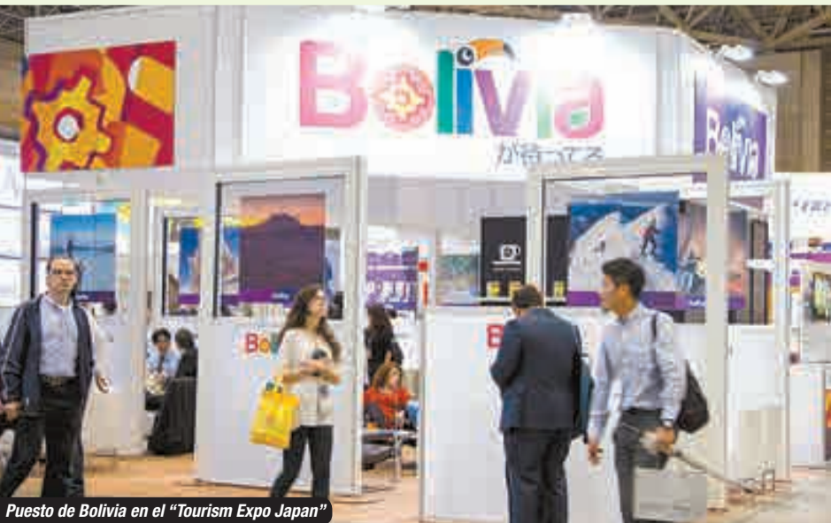
Puesto de Bolivia en el "Tourism Expo Japan"

El destino turístico favorito de los japoneses es sin duda el Salar de Uyuni, al que prefieren llegar en época de lluvia porque el agua que cubre el salar lo convierte en un espejo en el que se refleja el cielo, una imagen maravillosa e inolvidable. Según datos oficiales, el número de turistas japoneses registrados en Bolivia se ha triplicado desde 2010, hasta llegar a 17 mil visitantes en 2015. Esta tendencia incentiva a que los operadores de turismo bolivianos se esfuercen para atraer más turistas japoneses a Bolivia, comprendiendo sus preferencias y adecuando a ellas sus servicios. Además, con el apoyo del Gobierno boliviano, varias agencias de turismo y hoteles bolivianos participan en el "Tourism Expo Japan", organizado por la Asociación de Agencias de Viajes de Japón (JATA), en Tokio, donde llegaron 185 mil visitantes, con el fin de posicionar sus destinos turísticos a nivel mundial.