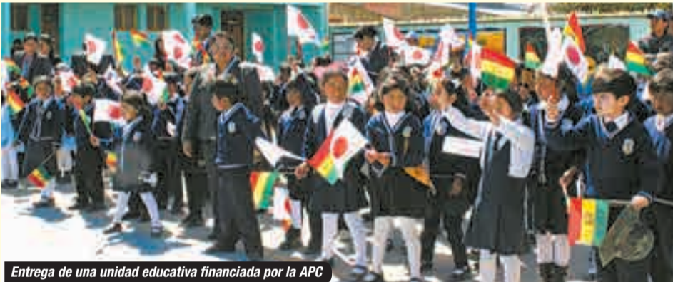
Entrega de una unidad educativa financiada por la APC

Otro esquema se denomina Asistencia Financiera No Reembolsable para Proyectos Comunitarios de Seguridad Humana – APC. Mediante este esquema, Japón apoya a las iniciativas locales que proponen proyectos de pequeña escala hasta un monto máximo de alrededor de 90 mil dólares americanos. Este esquema beneficia directamente a los pobladores de las comunidades de base a través de sus gobiernos regionales, municipalidades u organizaciones sin fines de lucro. Desde 1989 hasta la fecha se ejecutaron 587 proyectos en todos los departamentos sectores como la educación (construcción de escuelas), la salud (construcción de centros de salud o equipamiento), el agua (agua potable, sistemas de riego), entre otros. En el año fiscal 2015, que finaliza en marzo de 2016, fueron aprobados 16 proyectos que se encuentran en plena ejecución.