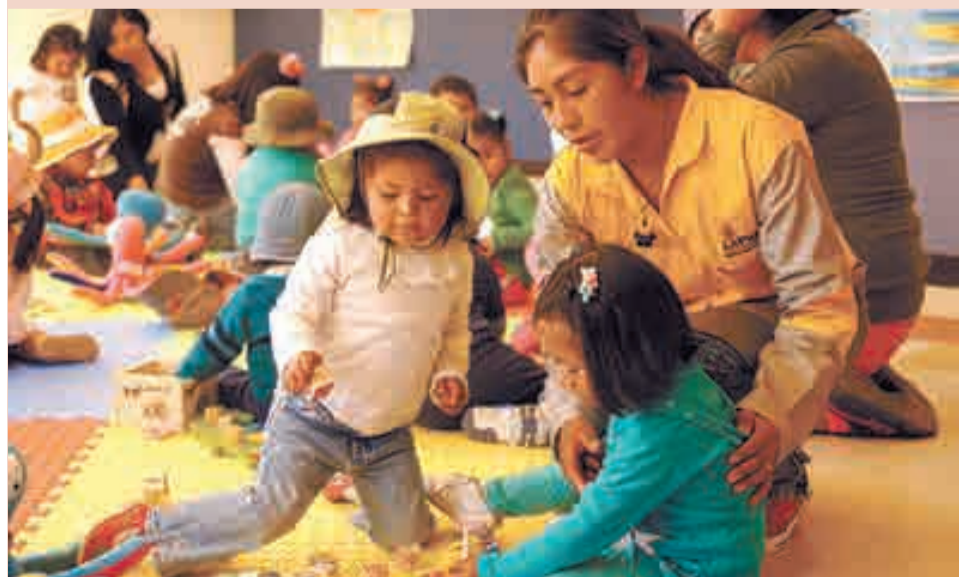
Proyecto del Banco Mundial para el desarrollo integral de la infancia temprana en La Paz y El Alto.

Para lograr una cooperación eficiente, es indispensable una buena coordinación entre los donantes. Japón ha asumido la Presidencia del Grupo de Socios para el Desarrollo de Bolivia (GruS) de julio a diciembre de 2016.