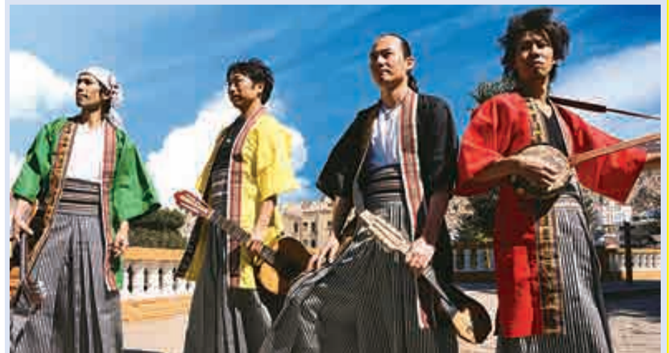
Grupo Musical Wayra JaponAndes

Hoy en día, los descendientes se extienden hasta la quinta generación para los inmigrantes preguerra y la tercera generación para los inmigrantes de la posguerra, quienes hoy son parte de la sociedad boliviana. Sus contribuciones se están diversificando a través de diferentes profesiones, como médicos, docentes, abogados, cocineros, periodistas, comerciantes, agentes turísticos, funcionarios o congresistas del Estado o de los gobiernos regionales, entre otros. La generación joven ha logrado alcanzar el éxito en el campo musical, como lo demuestra el notable grupo de músicos japoneses denominado "Wayra JaponAndes", creado el año pasado, el cual está ganando popularidad entre los bolivianos de todas las edades.