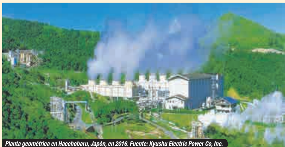
Planta geométrica en Hacchobaru, Japón, en 2016.