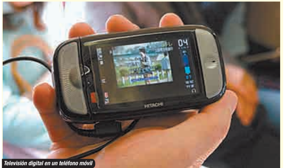
Televisión digital en un teléfono móvil

En julio de 2010, Bolivia decidió adoptar la norma japonesa de televisión digital terrestre ISDB-T (Integrated Services Digital Broadcasting - Terrestrial), mediante la firma de un Memorandum de Entendimiento suscrito con Japón, al igual que la mayoría de los países de América Latina. Esta norma garantiza una alta resolución de la imagen e importante fidelidad en el sonido a pesar de las dificultades geográficas que pudieran existir, como las montañas. Este estándar también permite transmitir no solamente a los aparatos fijos, sino también a los aparatos móviles. Además, las autoridades pueden emitir avisos de emergencia a los televisores o las radios en casos de desastres naturales. La interactividad es un elemento peculiar que permite la educación a distancia y ofrece la información requerida por los televidentes de manera simultánea.