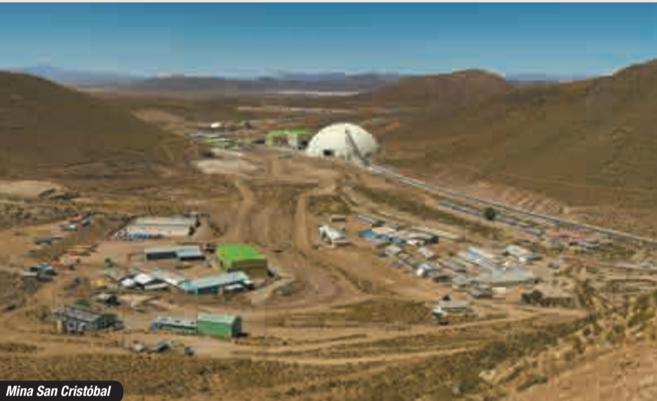
Mina San Cristóbal

En 2015, las exportaciones de Bolivia hacia Japón sumaron $us 407 millones, de acuerdo al Instituto Nacional de Estadística (INE), de los cuales el 97% corresponde a los minerales zinc, plata y plomo. El dinamismo de la actividad industrial del Japón demanda estos bienes para su desarrollo; por ejemplo, el zinc es muy requerido en la producción de chapas de acero dentro de la industria automotriz. La Minera San Cristóbal S.A. (MSC), ubicada en la provincia Nor Lipez del departamento de Potosí, es una empresa minera boliviana, subsidiaria de Sumitomo Corporation, uno de los consorcios empresariales líderes del Japón. La MSC explota uno de los yacimientos de zinc, plomo y plata más grandes del mundo y representa la mayor inversión japonesa en Bolivia con aproximadamente 1800 millones de dólares americanos. Estos recursos se emplearon en trabajos de exploración, estudio de factibilidad, estudios medioambientales, ingeniería del proyecto, preparación de la mina, construcción de la planta y de la infraestructura de apoyo, capital de operación, capital de sustento y gastos financieros. La MSC realiza sus operaciones combinando el uso de tecnología de punta con la permanente cualificación de sus trabajadores, el estricto control de salud y seguridad laboral e industrial, la preservación del medio ambiente y el compromiso social con las comunidades, buscando aportar al desarrollo de la región en la que opera, del departamento de Potosí y de Bolivia.