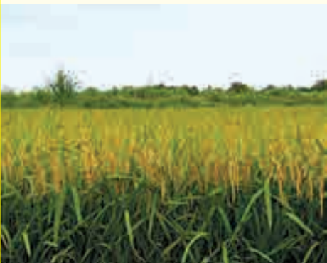
Arrozal en la Colonia San Juan