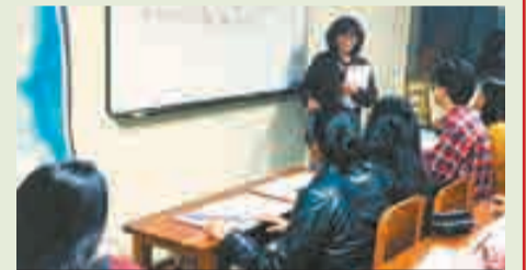
Curso de idioma japonés en la Sociedad Japonesa de La Paz

ofrece becas de posgrado y pregrado para estudiantes bolivianos, así como también otras especializadas para profesores de primaria y secundaria y otra de estudios sobre Japón para ciudadanos bolivianos descendientes de japoneses.