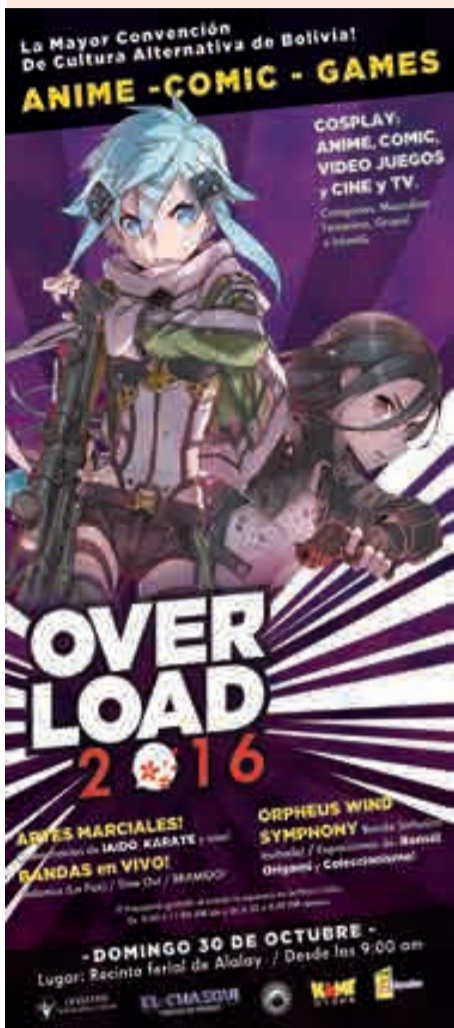
Afiche del Overload 2016