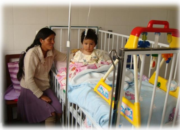
Hospital San Pedro Claver de Sucre (Chuquisaca)