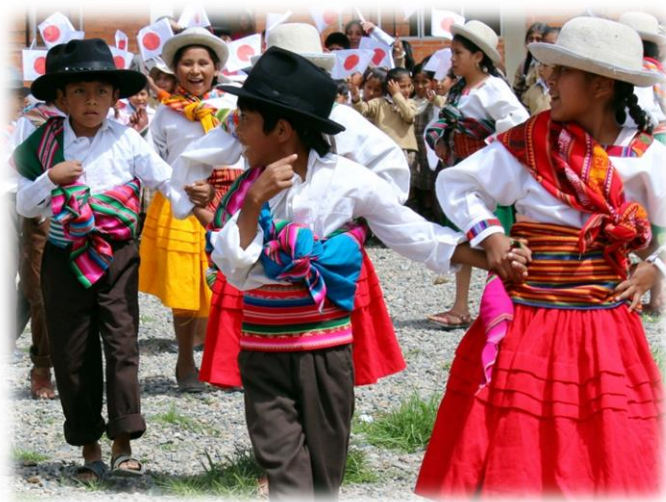
U.E. Guillermo Frías (Mecapaca, La Paz)

El Gobierno del Japón, desde el año 1989, propone un esquema de asistencia financiera no reembolsable para proyectos a pequeña escala, cuyo fin es el de satisfacer el gran número de necesidades de los países en vías de desarrollo. Desde marzo de 1999, Japón amplió esta modalidad, estableciendo un fondo, para llevar adelante proyectos dentro de la esfera de la “Seguridad Humana”.