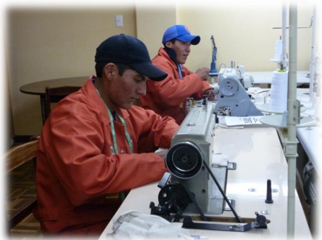
Centro Gregoria Apaza en El Alto (La Paz)

(3) Presentar el formulario de solicitud de forma impresa en las oficinas de la Embajada del Japón.