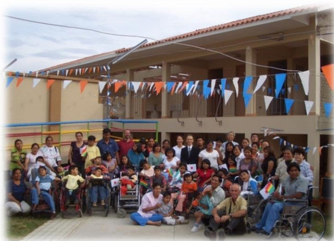
Centro para PCD San Martín de Porres en Tiquipaya (Cochabamba)

La flexibilidad en nuestro trabajo nos permite adecuar el esquema a las demandas de las poblaciones y comunidades que solicitan nuestro apoyo. Igualmente, el trabajo directo y continuo con entidades de todo el país nos brinda un mayor acercamiento de la realidad y de las necesidades de cada zona. Por ello y a través de la experiencia acumulada en las diferentes regiones de Bolivia, tenemos un amplio conocimiento del panorama en relación al desarrollo social del país.