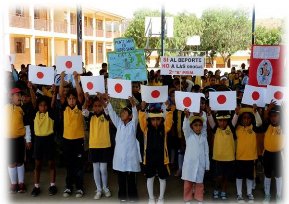
U.E. 6 de Agosto (Cochabamba)