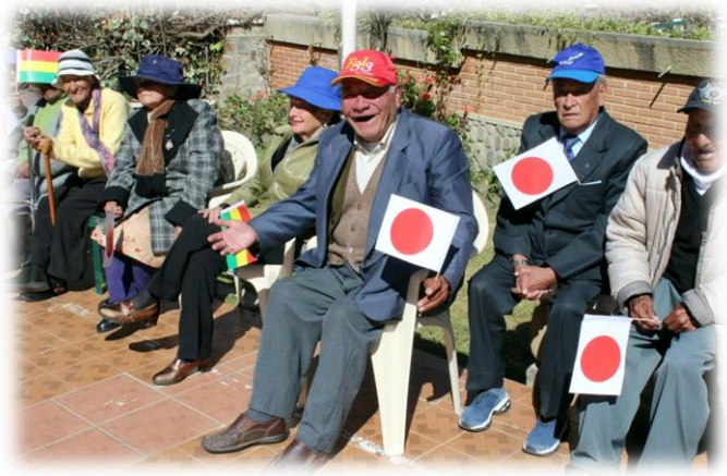
Hogar San Ramón (La Paz)

Cualquier tipo de proyecto de carácter social, en pro del desarrollo comunitario y orientado a mejorar las condiciones de vida de los grupos y poblaciones más vulnerables, de propiedad colectiva o pública y que pueda ser ejecutado en el plazo de un año.